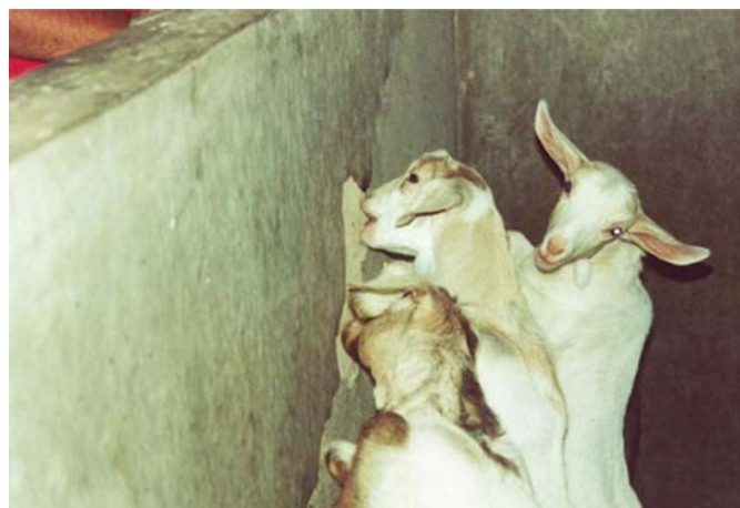
Fig.5. Caprinos jovens, não lactentes, roendo a parede da baia.