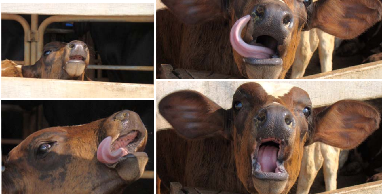
Fig.4. Sequência da estereotipia de “brincar com a língua” em um mesmo bezerro.

Sua origem, ainda que desconhecida, provavelmente deve-se a efeitos multifatoriais originados pelo empobrecimento ambiental, tais como o confinamento por longos períodos, ausência ( zero-grazing ) ou pouco tempo gasto pastando, excesso de alimentos finamente moídos e o aleitamento artificial mal feito. Os bovinos evoluíram, por milênios, vivendo em liberdade e utilizando sua língua para sentir e coletar alimentos fibrosos de grande tamanho (Van Soest 1994); dessa forma, a ausência ou o pouco tempo disponibilizado para pastar, a oferta constante da dieta e a ingestão de partículas finamente moídas reduzem as atividades de caminhar livremente, mastigar e ruminar sendo, portanto, motivos geradores de “frustração” nos animais. Já em bezerros lactentes, se grande quantidade de leite for ministrada em uma ou duas mamadas diárias e este for dado em baldes ou em mamadeiras cujo orifício do bico foi alargado com o objetivo de reduzir o tempo gasto para aleitar os animais, um grande volume de leite passará rapidamente pela boca, reduzindo a sensação de permanência desse alimento na cavidade oral e, portanto, esse manejo pode causar um sentimento de “frustração”, pois os mamíferos precisam de desenvolver o hábito de sucção quando lactentes.