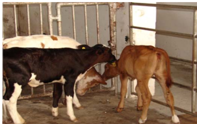
Fig.9. Três bezerras lactentes fazendo cross-sucking .

jam os principais fatores que desencadeiam o cross-sucking nos bezerros. Esse comportamento pode permanecer ativo mesmo após a desmama, quando os animais se sentem “frustrados” ao esperar o fornecimento de concentrados (Fig.10). O grande problema é que esse hábito pode resultar em danos ao úbere (Fig.11), mamite imediatamente ao primeiro parto e descarte antecipado dos animais que sofrem cross-sucking . Nos casos mais extremáticos alguns animais mamam em si mesmos e nos demais companheiros do rebanho (Fig.12).