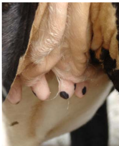
Fig.11. Úbere do animal que sofreu cross-sucking na Figura 10.