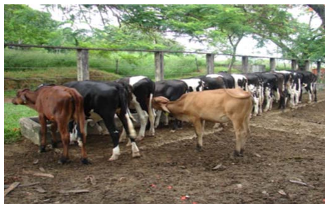
Fig.10. Bezerra desmamada mamando em outra enquanto o lote ingere o arraçoamento matinal.