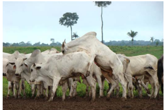
Fig.2. Animal criado em ambiente de pastagem e praticando sodomia.

lidade final da carcaça (Ítavo et al. 2008), alguns criadores têm optado por manter os animais não castrados nos confinamentos ou nas pastagens. Porém, lotes de animais inteiros pós-púberes, com grande variação de peso e submetidos à elevadas taxas de lotação, sobretudo em presença de outros fatores externos, como estresse térmico, espaço reduzido de sombra e excesso de lama, passam a exibir sodomia, que é um distúrbio comportamental que se caracteriza quando um animal é repetidamente montado por outro(s), maior(es) e mais forte(s), que acaba(m) por feri-lo ou até mesmo levá-lo a morte (Barbosa, comunicação pessoal 2010). A sodomia pode estar mais relacionada com o empobrecimento ambiental e com a degradação do bem-estar dos animais do que propriamente com o desejo sexual. Os animais dominantes, que saltam repetidamente sobre os outros, lesionam os cascos posteriores, pois a intensa pressão do peso sobre as unhas causa danos à microcirculação do casco, o que origina hematomas na sola, seguidos por ulcerações nas mesmas. Essas lesões podais interferem negativamente no consumo de alimentos, reduzem o ganho de peso, comprometem a saúde dos animais e geram despesas consideráveis com seu tratamento.