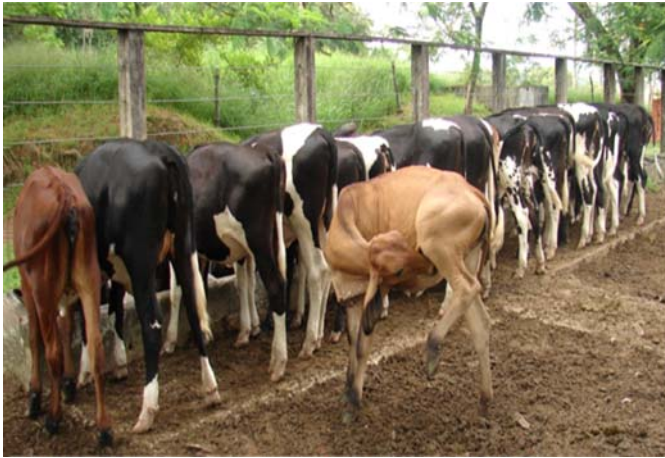
Fig.12. Enquanto todos os animais comem o concentrado a bezerro, habituada a fazer cross-sucking nas outras, começa a mamar em si própria.

As formas, ainda que empíricas, de minimizar o cross-sucking nos bezerros seria aleitá-los em separado (amarrá-los, distantes uns dos outros, no momento do aleitamento e, após mamarem, deixá-los 10 a 15 minutos presos), evitar ofertar o leite em baldes, dar preferência a sistemas que usem tetas artificiais cujo furo na ponta do bico possui diâmetro reduzido, fornecer um pouco de água (via qualquer sistema com teta artificial), lavar a boca após a ingestão do leite (isso remove o gosto do leite na boca dos animais) e retirar do grupo o animal que porventura apareça com essa alteração, pois especula-se que os animais aprendam, por imitação, a fazer o cross-sucking .