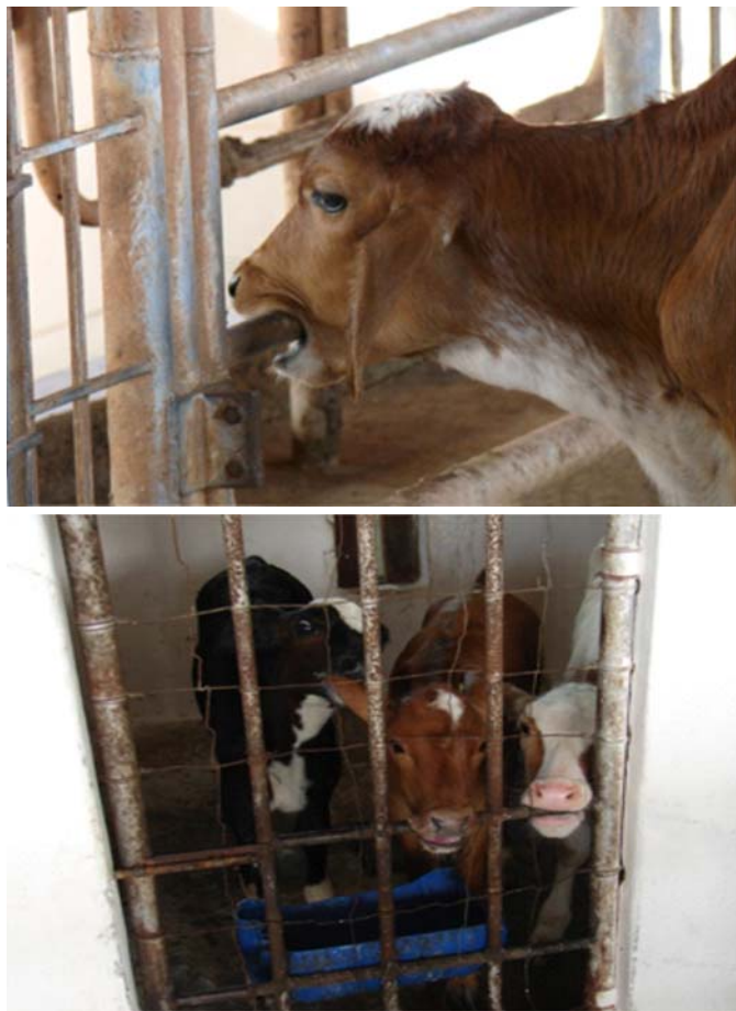
Fig.8. (A) Animal mordendo cano. (B) Duas bezerras mordendo cano e uma chupando a orelha de outra após receberem 2 litros de leite via balde.

sar pouco tempo depois do aleitamento. De Passilé et al. (1992) verificaram que é normal os bezerros, após o aleitamento artificial, realizarem as seguintes atividades: chuparem ou mastigarem objetos presentes nos abrigos, explorarem o interior do abrigo e, por fim, descansarem.