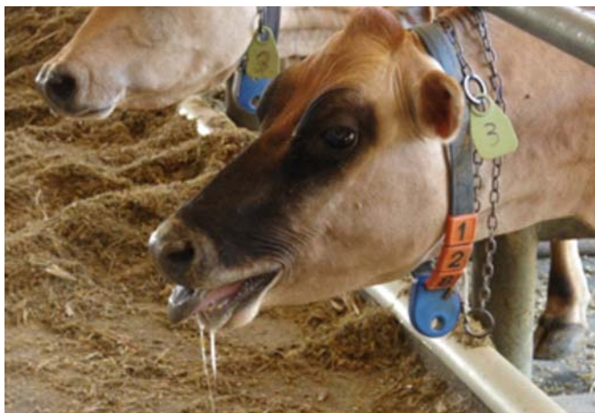
Fig.3. Estresse térmico em vacas criadas em sistema tiestall.