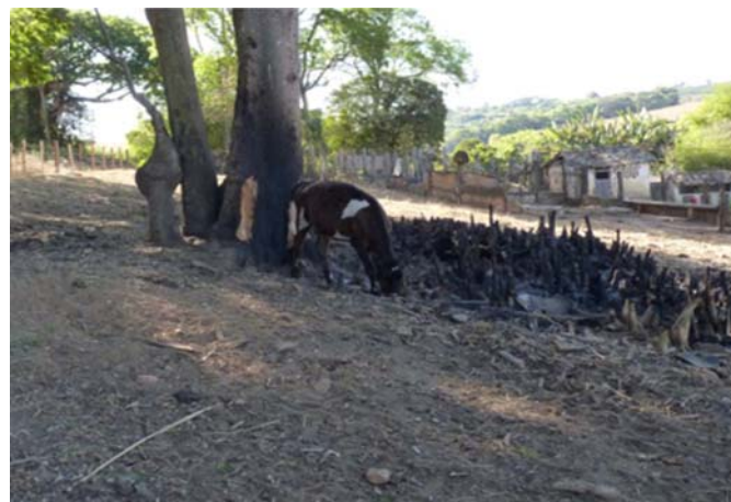
Fig.7. Árvore roída e pasto rapado.

Decorrentes do sistema de aleitamento. Um desvio comportamental frequentemente observado é o hábito de mastigar e/ou sugar madeira, trincos, cadeados ou canos de ferro (Fig.8a,b) utilizados para a construção dos abrigos onde os bezerros são criados, isoladamente ou não, em sistemas de aleitamento artificial e aleitados duas vezes por dia. Entretanto, é necessário identificar se esse hábito é persistente ao longo do dia, de forma repetitiva, regular ou invariável, o que caracterizaria uma estereotípia. Na maioria das vezes esse hábito é um comportamento não estereotipado resultante da rápida ingestão de um grande volume de leite (fornecido em baldes ou em mamadeiras cujo bico teve seu orifício alargado) e da visualização do tratador ainda fornecendo leite aos demais bezerros (Fig.8b). Neste caso, esse hábito tende a ces-