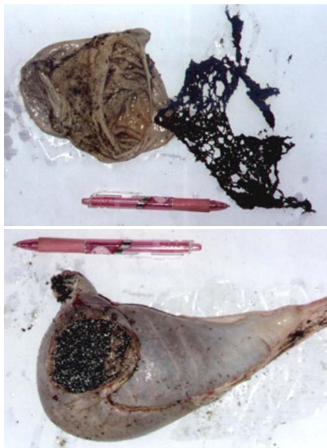
Fig.6. Plástico no abomaso de vitelos com 62 dias de vida.

Noutra ocasião, com o objetivo de testar a viabilidade da produção de vitelos caprinos da raça Saanen, um caprinocultor confinou alguns machos recém-nascidos e passou a alimentá-los exclusivamente com leite de vaca fornecido em quantidade crescente a cada semana. Decorridos cerca de 50-55 dias, houve uma previsão da meteorologia que uma frente fria passaria pela região e que a temperatura noturna poderia atingir 2-5°C. Mediante essa previsão, o proprietário resolveu por uma lona plástica preta na única lateral da baía que era feita de ripas de madeira espaçadas a cada 5 cm; após a fixação da lona, os animais praticamente a devoraram em poucos dias, sendo que vários morreram por obstrução abomasal, demonstrando claramente que essa perversão do apetite se deveu à imperativa necessidade de fibra pelos animais (Fig.6). (Malafaia, dados não publicados 2005)